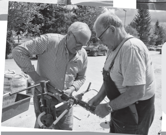
MGO Altmetall- sammlung