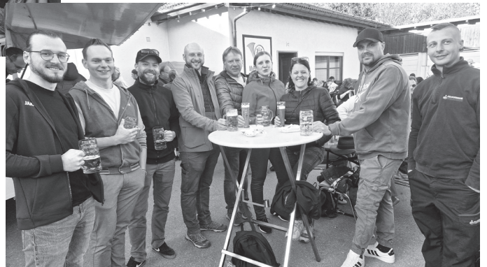
Maischerz an der Volksbank