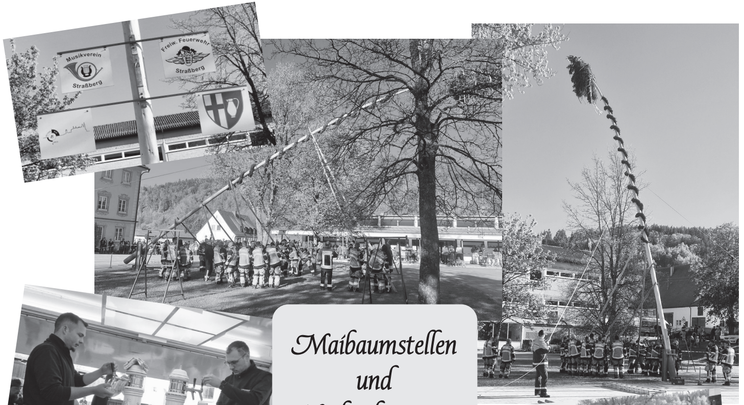
Maibaumstellen und Maikockete 2026