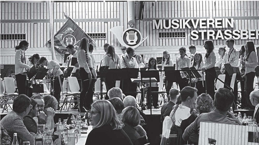
Jahreskonzert Musikverein Straßberg